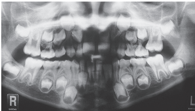
Рис. 1.3 Ортопантограмма.