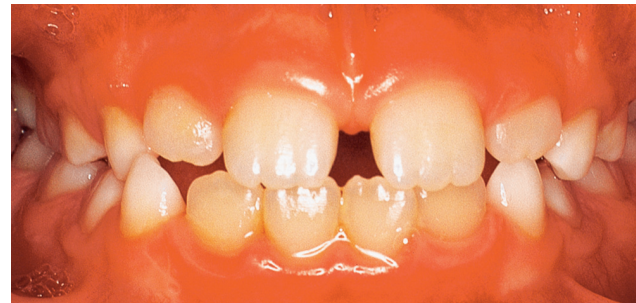
Рис. 1.5 Смыкание зубов фронтальной группы после прорезывания верхних постоянных латеральных резцов.

саморегуляции в процессе дальнейшего формирования прикуса.