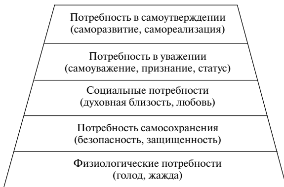
Рис. 2. Иерархия потребностей по Маслоу.

Существует определенная иерархия потребностей, представленная на рисунке 2. Из нее видно, что с развитием личности растет и уровень (характер) ее потребностей; и если базовые (средние) потребности присутствуют у всех индивидуумов, то потребности 3–5-го уровней – у значительно меньшего их числа. Кстати, данную структуру потребностей следует учитывать и в деятельности любого менеджера. Удовлетворяя те или иные потребности подчиненных, он добивается