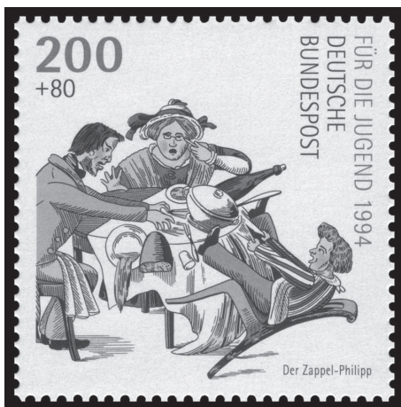
Рис. 2.3. Марка с изображением Непоседы Фила.