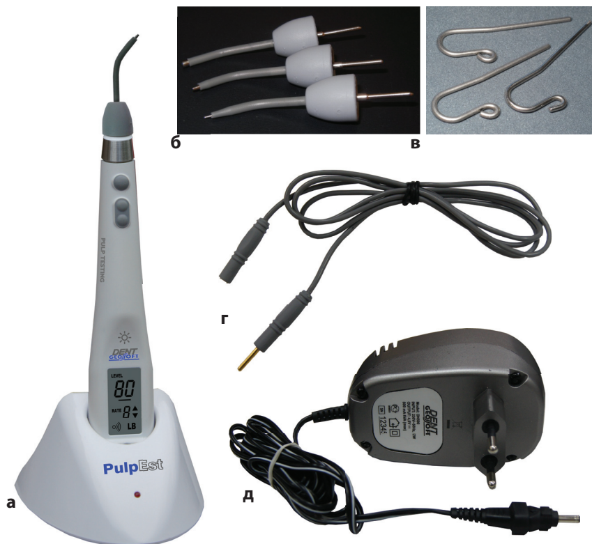
Рис. 2. Аппарат для ЭОД ПульпЭст (Geosoft-Dent):