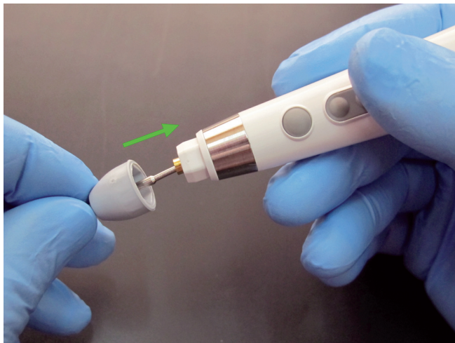
Рис. 4. Фиксация активного электрода на беспроводном блоке управления.

его в обратном направлении, удерживая за фиксирующий колпачок, повернуть в нужном направлении и снова зафиксировать на блоке управления.