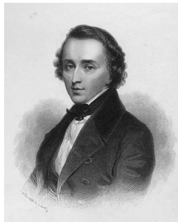
Фредерик Шопен (1833 г.)

друзей, воспоминания современников дают уникальную возможность проанализировать и оценить особенности течения заболевания великого композитора.